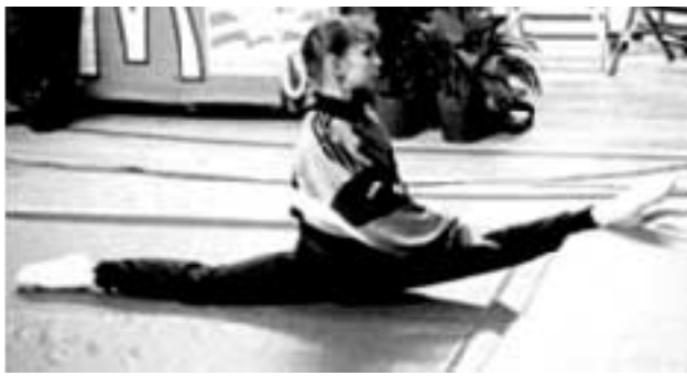
Assouplissement de la hanche