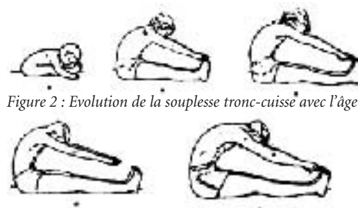
Figure 2 : Evolution de la souplesse tronc-cuisse avec l'âge

A l'évidence, le nourrisson et le jeune enfant sont capables de réaliser des mouvements beaucoup plus amples que ne peuvent le faire l'adolescent, l'adulte ou encore le senior. Cela vient de l'immaturité morphologique et structurale des articulations, ligaments et autres muscles. Cependant, la maturité n'est pas obligatoirement synonyme de raideur, à condition de s'en donner les moyens. La souplesse est fréquemment évaluée par un test de flexion du tronc sur les cuisses. Or, naturellement celle-ci se modifie en fonction de l'âge (Figure 2), en liaison avec l'augmentation de la raideur des ischio-jambiers et des muscles lombaires.