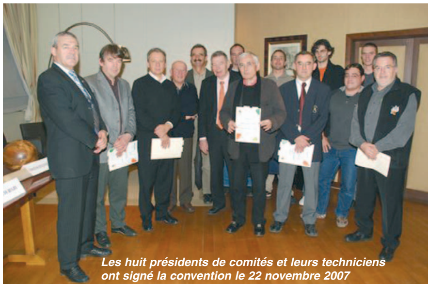
Les huit présidents de comités et leurs techniciens ont signé la convention le 22 novembre 2007

Pour la 3 ème saison consécutive, le Conseil Général et les comités de Basket, Football, Handball, Judo, Pétanque, Quilles de huit, Rugby à XV et Tennis ont renouvelé un