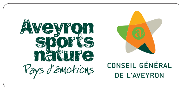
Charte graphique départementale pleine nature

Elle accompagnera l'inscription des sites de pratique au PDESI.