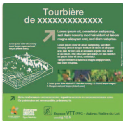
Panneau pédagogique de site remarquable