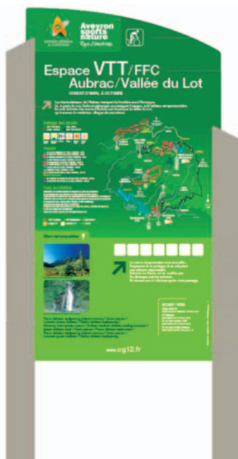
Panneau général de site labellisé