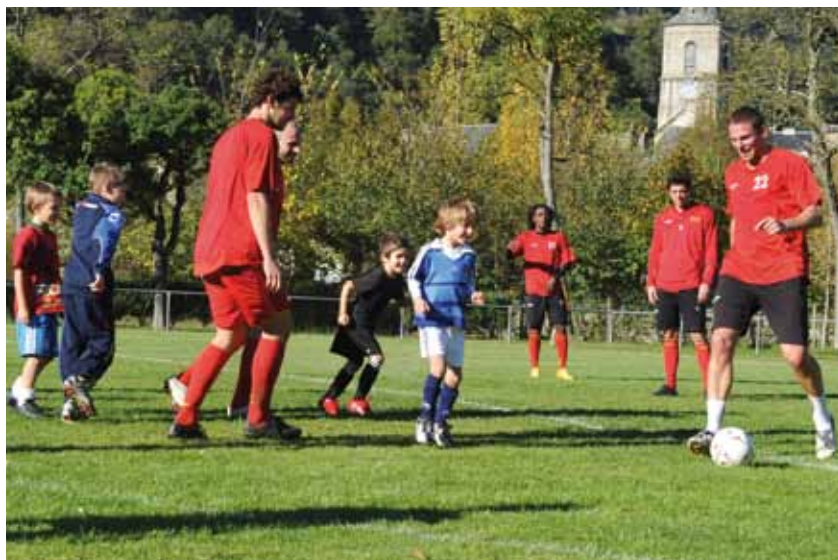
Sur le terrain d'Enraygues

Opération d'intérêt général inscrite dans le partenariat entre le Rodez Aveyron Football et le Conseil général, les « Mercredis du foot » saison 2010/11 ont repris depuis fin octobre.