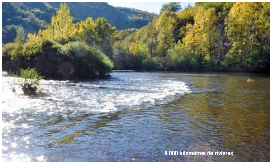
8 000 kilomètres de rivières

L'or bleu est de plus en plus convoité, avec des usages multiples : consommation des particuliers, production d'énergie, industrie, agriculture, activités de loisirs (nautisme, pêche), tourisme... Cette précieuse richesse est donc fragile, en Aveyron aussi. En effet, les caractéristiques géographiques du départe-