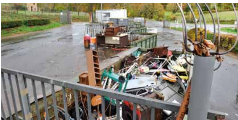
La déchetterie de Marcillac

Autre déchet spécifique : les boues issues de l'assainissement. Le schéma départemental a identifié 74 plans d'épandage qui captent environ 90% du tonnage. Il existe aussi deux unités de traitement, à Marcillac et Espalion, pour du co-compostage (boues et déchets verts).