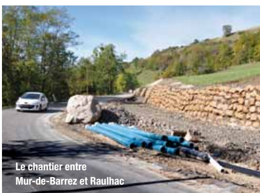
Le chantier entre Mur-de-Barrez et Raulhac

La liaison, par la RD 900, entre Mur-de-Barrez et Aurillac est importante pour l'ensemble du Carladez dont les liens avec le Cantal tout proche sont évidents. Les travaux réalisés en 2009 sur la section de Trionac, en limite des deux départements, ont permis d'aménager la route sur un peu plus d'un