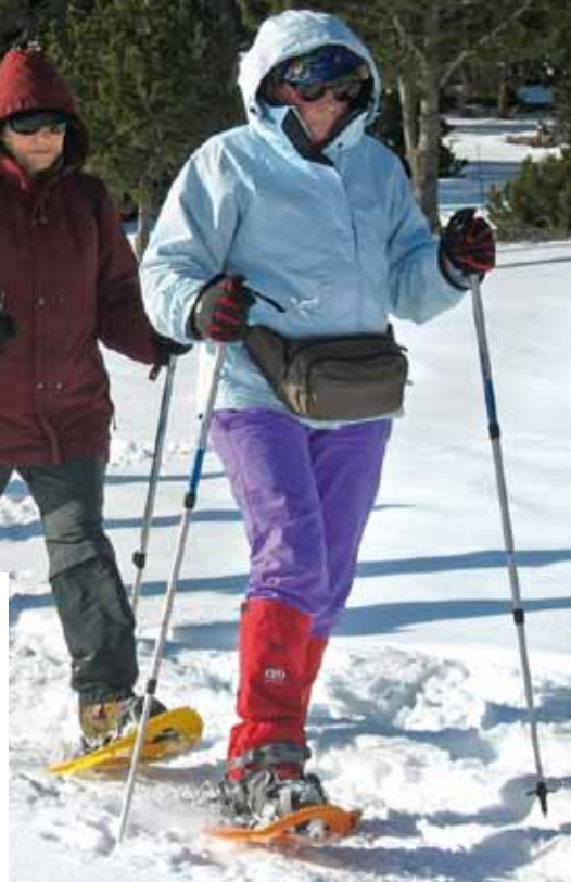
Raquettes sur l'Aubrac

1 500 adhérents, 13 clubs et sections, des activités physiques totalement adaptées aux seniors : tel est le Comité départemental de la retraite sportive de l'Aveyron (CODERS 12).