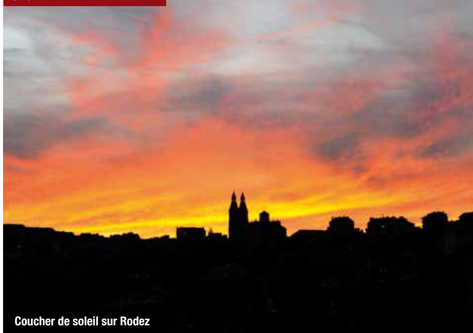
Coucher de soleil sur Rodez