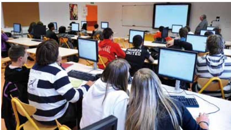
Démonstration en cours de géométrie avec des élèves de 6 e