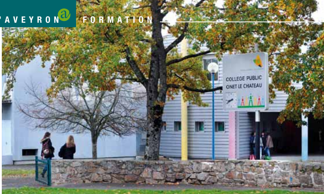
Un projet important pour le collège d'Onet-le-Château