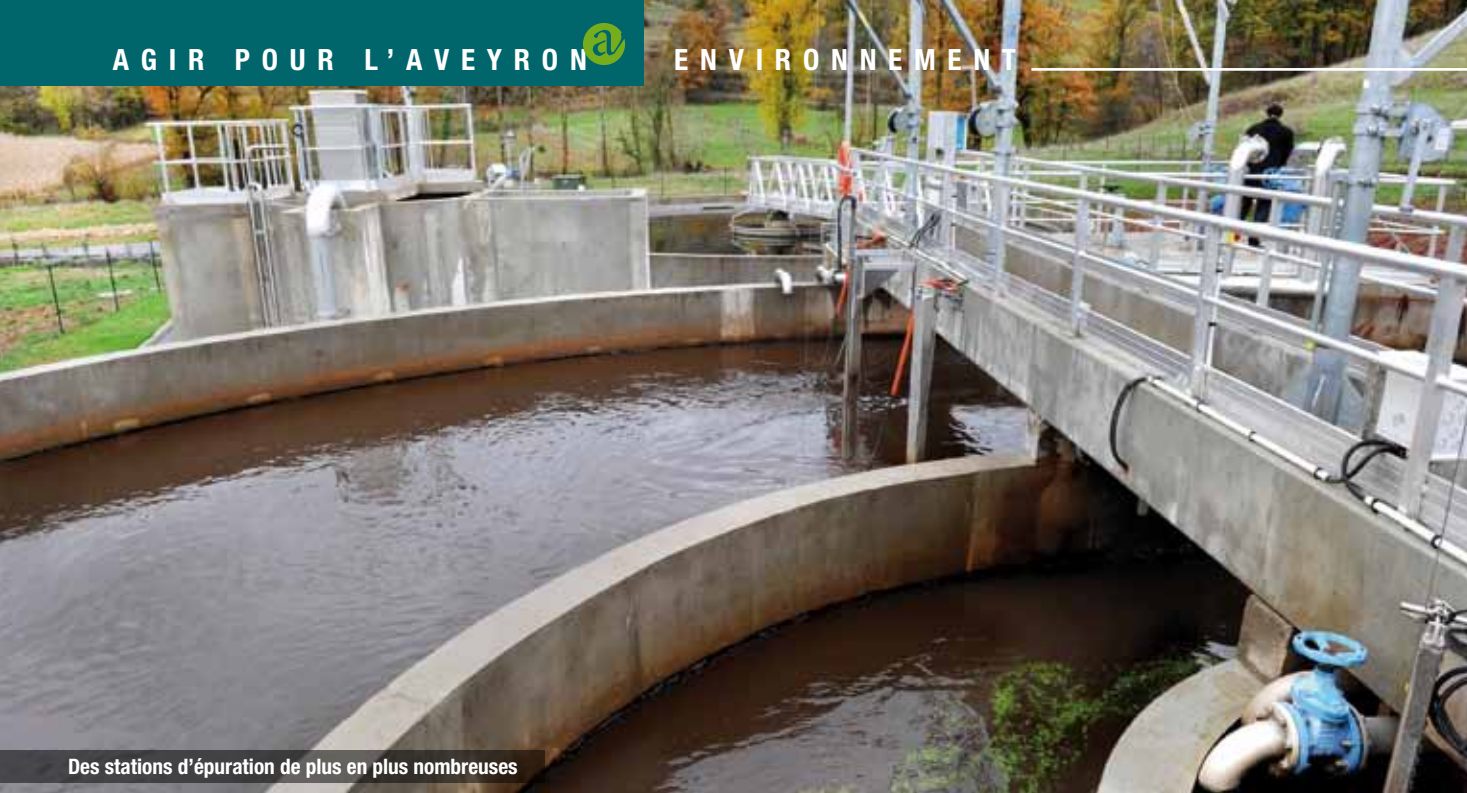
Des stations d'épuration de plus en plus nombreuses