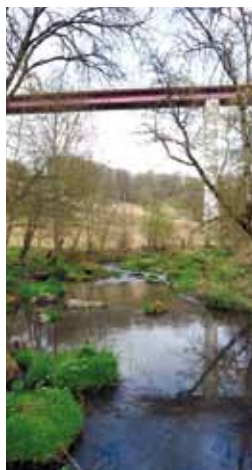
Le viaduc à 55 m au-dessus du Viaur

Ainsi, quelque 3 kilomètres de haies sont créés le long du contournement, ce qui représente environ 4 200 plants, essentiellement des essences