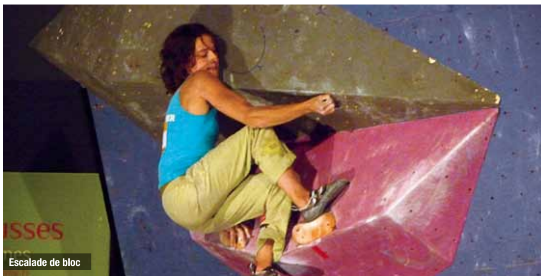
Escalade de bloc