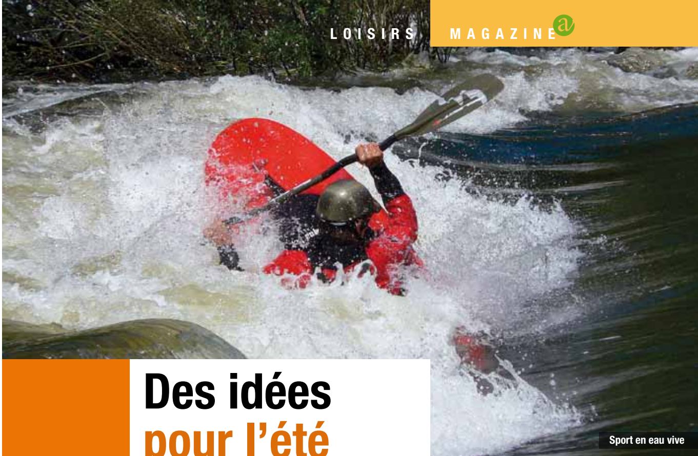
Sport en eau vive