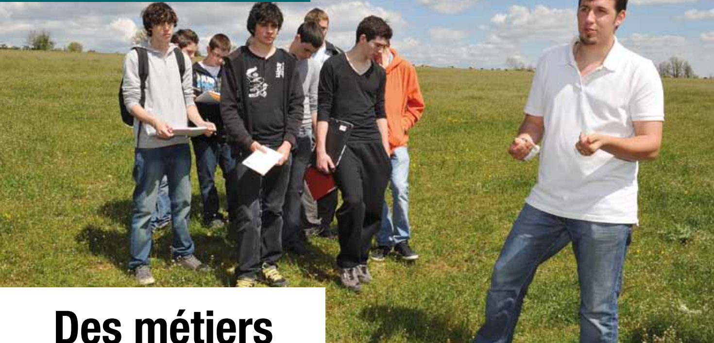
L'agriculture expliquée aux jeunes Aveyronnais