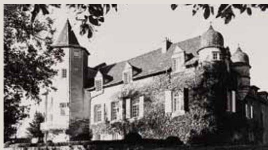
Le château de Labro, édifié par la famille de Créato au début du XVI e

La conférence inaugurale, consacrée à la peinture française du XVII e siècle et sa redécouverte aux XIX e et XX e siècle, sera prononcée par Pierre Rosenberg, de l'Académie française, président directeur général honoraire du musée du Louvre, le 9 juin à 21h à Rodez. Renseignements : Société des Lettres, 05 65 42 75 93 ; soc.lettres.aveyron@orange.fr