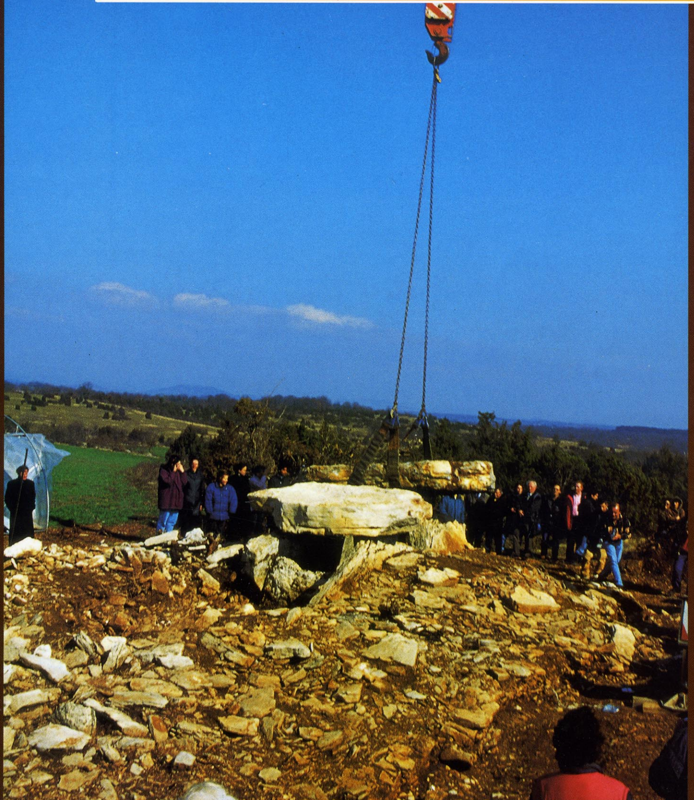
Remise de la table du dolmen II de Peyrelevade à Salles-la-Source