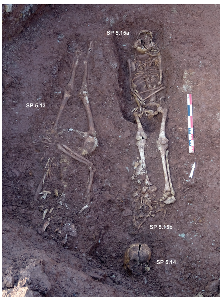
Fig. 2 : Rodez. Place du Sacré-Cœur. Les sépultures anciennes mises au jour dans la tranchée 5 (cl. S. Duchesne).