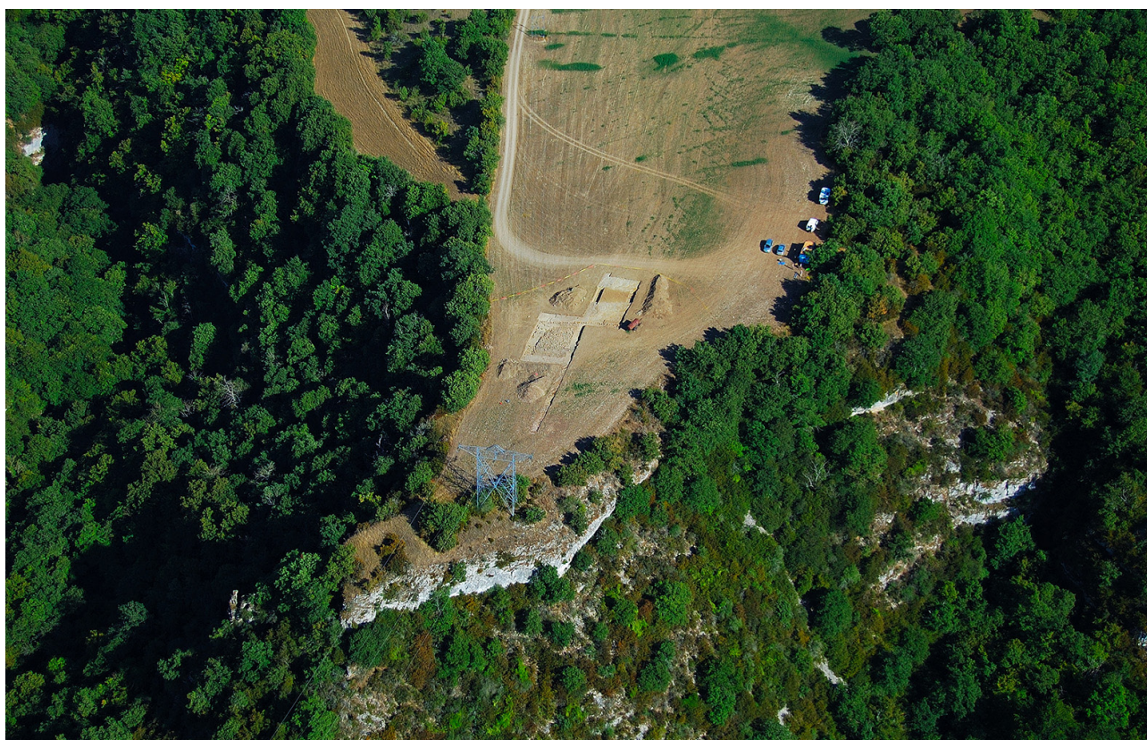
Fig. 1 : Vue aérienne du promontoire à stèles lors de la campagne d'août 2008.

La fouille n'étant que très partielle (492 m 2 ouverts sur une superficie de 0,4 ha), il ne s'agit