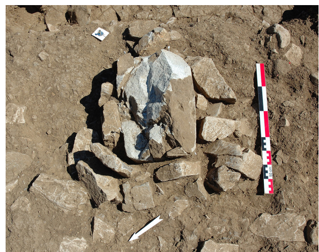
Fig. 3 : Base de la stèle 13 encore en place, avec son calage, à la surface du tertre de terre u.s. 1011.

Au cours de la phase II, un tertre de terre (u.s. 1011) est donc construit sur le site (tumulus ?). Partiel-