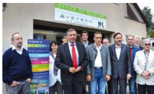
Lancement de l'opération sur le premier site équipé, à Pont-de-Salars

C'est la raison du partenariat entre le Conseil général et les OT, avec l'appui du Comité départemental du tourisme, qui s'enrichit d'une nouvelle action. Celle-ci est destinée à rendre plus visibles et plus efficaces ces véritables « portes d'entrée » des terri-