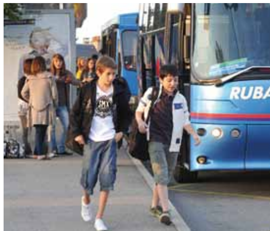
Un réseau dense desservi par 250 transporteurs

le Conseil général « fait du cousu main, en s'adaptant à la demande et aux conditions géographiques du département. C'est un service de véritable proximité ».