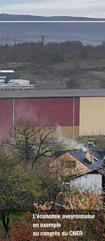
L'économie aveyronnaise en exemple au congrès du CNER