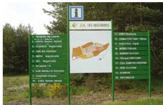
L'économie aveyronnaise dans son environnement rural