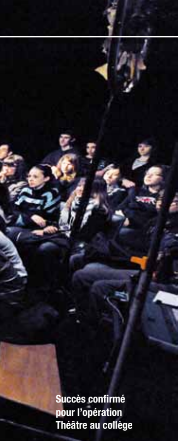
Succès confirmé pour l'opération Théâtre au collège