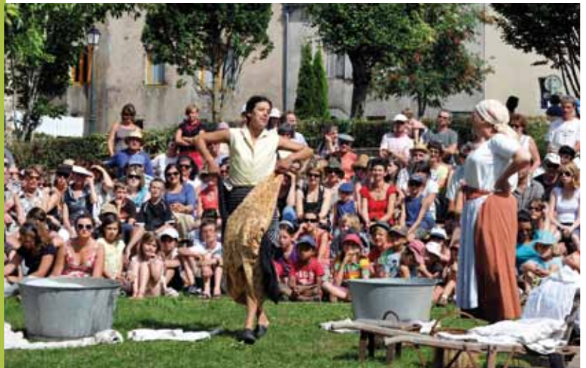
Festival en bastides