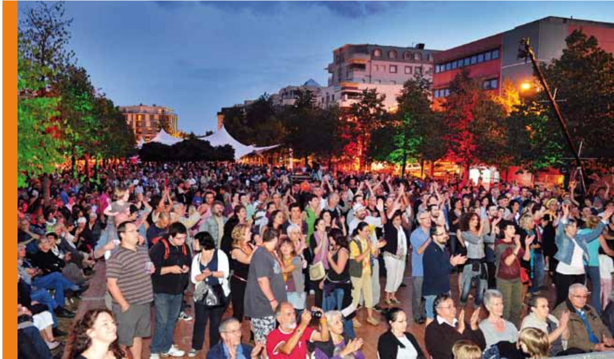
L'Estivada de Rodez