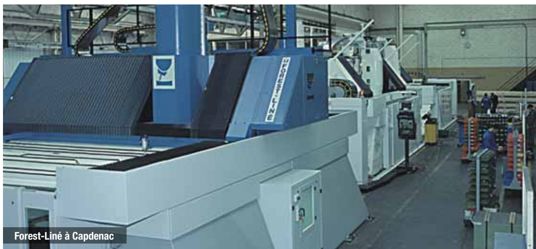
Forest-Liné à Capdenac

Le cercle des Dirigeants aveyronnais est animé par Aveyron Expansion et l'Amicale aveyronnaise et compte quelque 170 membres. Il s'agit d'un réseau informel dont l'un des prochains événements sera organisé en octobre à Paris autour du thème de l'Aveyron et le luxe.