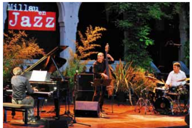
Millau en jazz