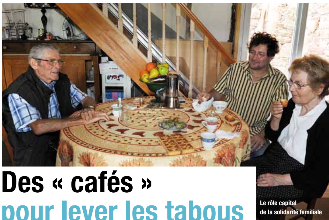
Le rôle capital de la solidarité familiale

Centre médico-social de Villefranche-de-Rouergue tél. 05 65 45 89 00 ou Centre social tél. 05 65 45 38 70