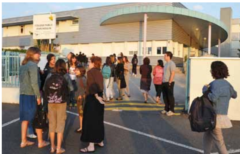
Plusieurs chantiers importants dans les collèges publics