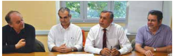
La convention qui lie le Conseil général et la communauté de communes pour la Maison de santé a été signée le 2 juillet à Entraygues.