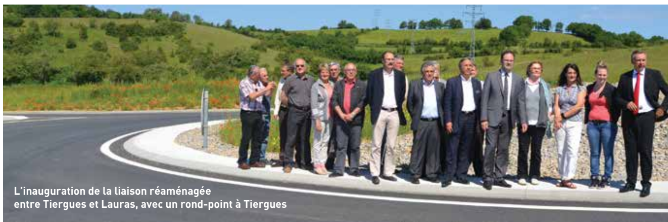
L'inauguration de la liaison réaménagée entre Tiergues et Luras, avec un rond-point à Tiergues

Cette opération, estimée à 7 M€, est financée par l'Etat, le Conseil régional et le Conseil général dans le cadre du contrat de Plan.