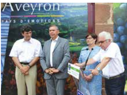
Les nouveaux équipements de l'Office de tourisme Conques-Marcillac ont été inaugurés le 10 juillet.

Conques-Marcillac vient de se constituer en communauté de communes, avec le développement économique comme moteur de son action.