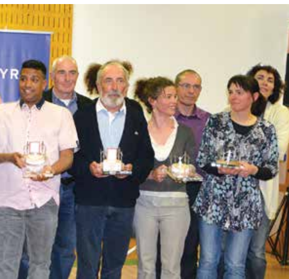
Les lauréats ont été reçus au Conseil général