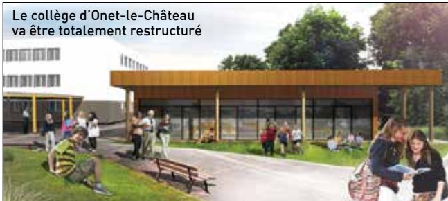
Le collège d'Onet-le-Château va être totalement restructuré

Autre chantier marquant de cette rentrée : le remplacement de la chaufferie du collège de Pont-de-Salars. Le bois est conservé, complété par le gaz. En parallèle, le système de sécurité incendie sera remplacé. Les travaux, qui ont débuté, se termineront à l'automne. L'investissement est de 350 000 €.