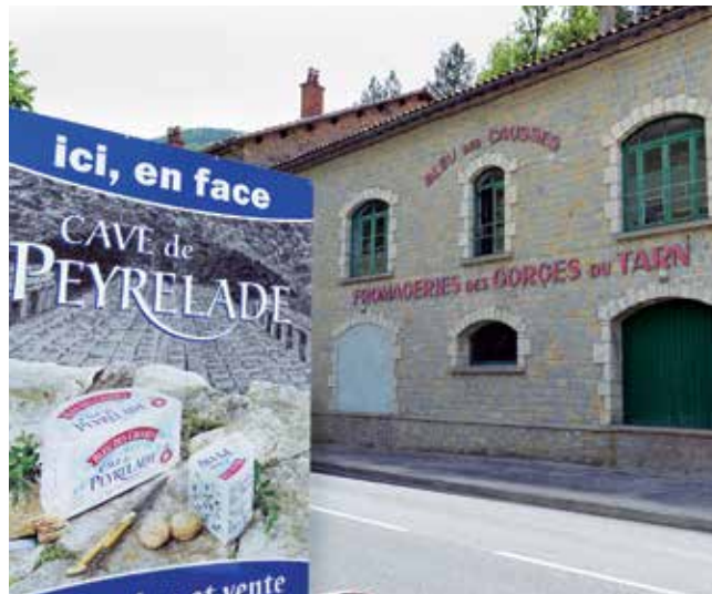
Le site d'affinage de Peyrelade

C'est une première étape. Dans trois ou quatre ans, la zone d'appellation sera recentrée autour des causses. Autant de précisions données par le président de l'interprofession du bleu des causses,