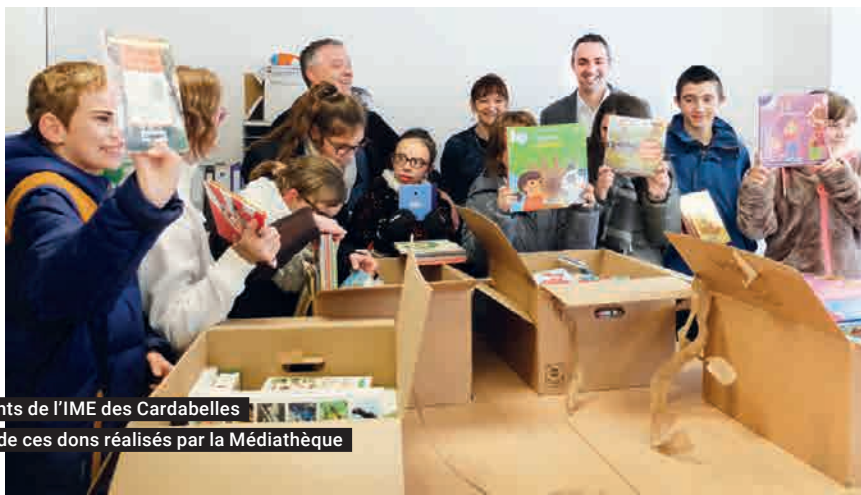
Les enfants de l'IME des Cardabelles heureux de ces dons réalisés par la Médiathèque

Enfin la Maison Départementale de l'Enfance et de la famille est également bénéficiaire de 1500 documents.