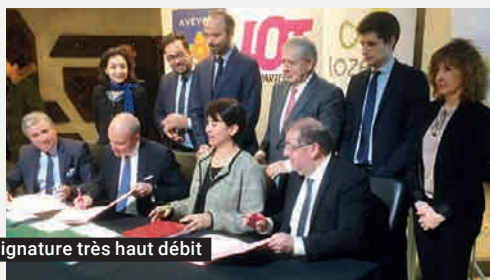
Signature très haut débit