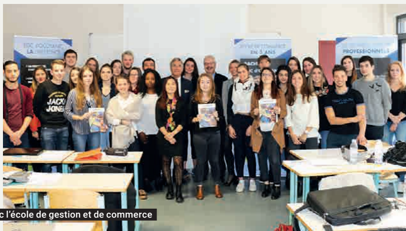
Avec l'école de gestion et de commerce