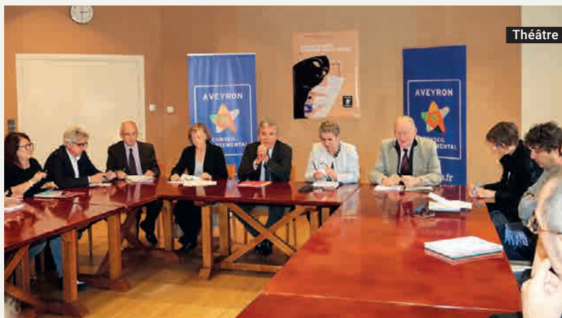
Théâtre au collège

Le Conseil départemental a reconduit, pour la dixième année consécutive, l'opération théâtre au collège. Il s'agit d'apporter un concours à l'éducation artistique et culturelle des jeunes, des collégiens en particulier. Ils peuvent ainsi assister à une représentation théâtrale et bénéficier de quelques heures de préparation au spectacle. L'immense majorité des collèges participe à cette opération qui est menée en partenariat avec les programmateurs culturels du département, ainsi qu'avec Aveyron Culture - Mission départementale.