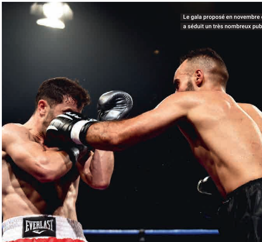
Le gala proposé en novembre dernier a séduit un très nombreux public

« Aujourd'hui la boxe à Rodez se développe bien. Et le succès des deux galas nous incitent à poursuivre dans cette voie, même si nos installations actuelles – local partagé avec d'autres sports de combat – ne permettent pas à nos jeunes boxeurs de s'entraîner aussi facilement qu'ils le souhaiteraient ».