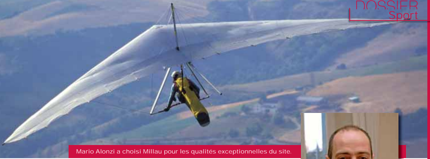
Mario Alonzi a choisi Millau pour les qualités exceptionnelles du site.