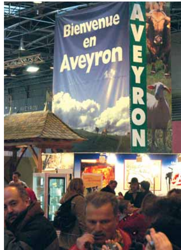
Le 43 e Salon International de l'Agriculture a permis à de nombreux visiteurs de découvrir les charmes et les richesses de l'Aveyron.

Cette 6 e participation consécutive à la manifestation parisienne traduit la grande complémentarité entre le Conseil général et les chambres consulaires, et témoigne de la volonté d'accompagner les filières agricoles et touristiques pour valoriser des produits de qualité. ■