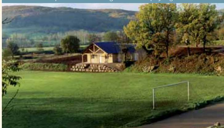
Légèrement surélevés et couverts de lauzes de pays, les nouveaux vestiaires sont parfaitement intégrés dans le paysage.