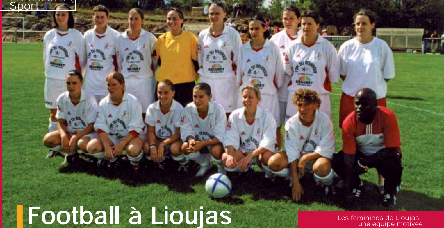
Les féminines de Lioujas : une équipe motivée