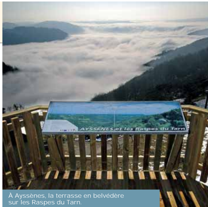
À Ayssènes, la terrasse en belvédère sur les Raspes du Tarn.

La plupart de ces 18 étapes sont équipées de tables de pique-nique. Certaines offrent même des sanitaires et des tables d'orientation. Les derniers aménagements de ce projet, dont le financement a été assuré à hauteur de 70% par le Département, la Région, l'Etat et l'Europe, interviendront d'ici l'été 2006. Pour Alain Marc, conseiller